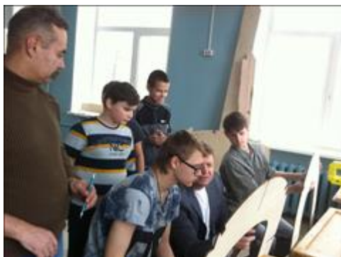
"Куда его нанести?" Каждая деталь самолета должна иметь свою маркировку.