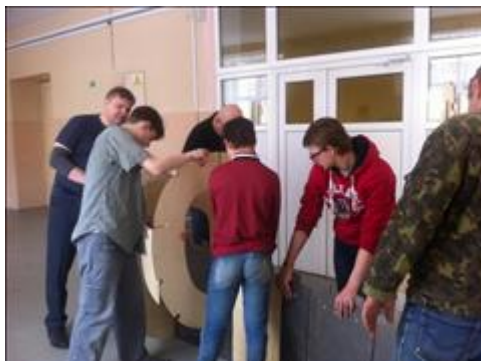
"Каждая деталь на свое место" Сборка хвостовой части самолета.