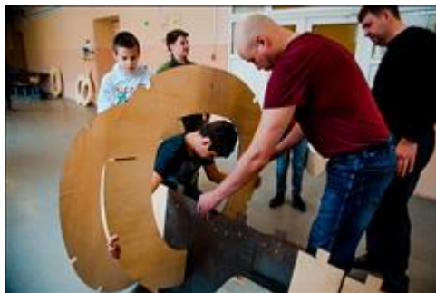
"И так, и этак! " Предварительная сборка хвостовой части самолета.