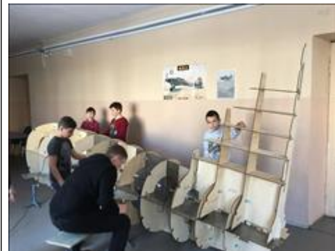
"Последние штрихи" Сборка хвостовой части самолета.