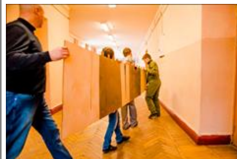
"Какая же она длинная!" Перенос готовых длинномерных деталей к месту сборки из столярной мастерской.