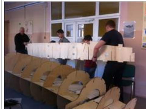
"Вместе дело спорится!" Сборка хвостовой части самолета.