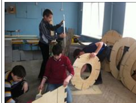
"Нет жучкам, нет огню, нет плесени! " Обработка деталей самолета специальным составом.