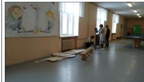
"Все детали на месте? " Прием и проверка всех привезенных для сборки деталей хвостовой части у завода.