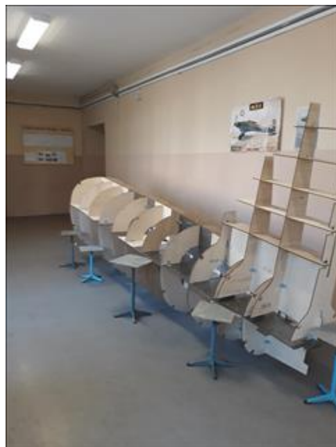
Хвостовая часть полноразмерной копии самолета Ил-2 Хвостовая часть полноразмерной копии самолета Ил-2 собранная в рамках проекта "Две страны - один герой!".

Информация, указанная Вами в данном поле отчета, будет доступна для посетителей сайта Фонда президентских грантов (в том числе представителей СМИ)