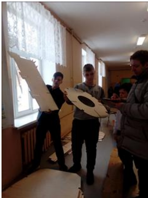
"Ура! Первые детали привезли на сборочную площадку!" Доставка в школу первых деталей, изготовленных на заводе.