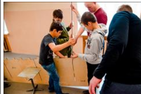
"Как же она вставляется?" Предварительная сборка деталей хвостовой части самолета.