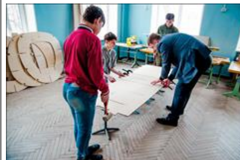
"Соединим, укрепим и закрепим" Стыковка и усиление длинномерных деталей самолета, которые не могли быть выполнены на заводе целиком из-за своих размеров.