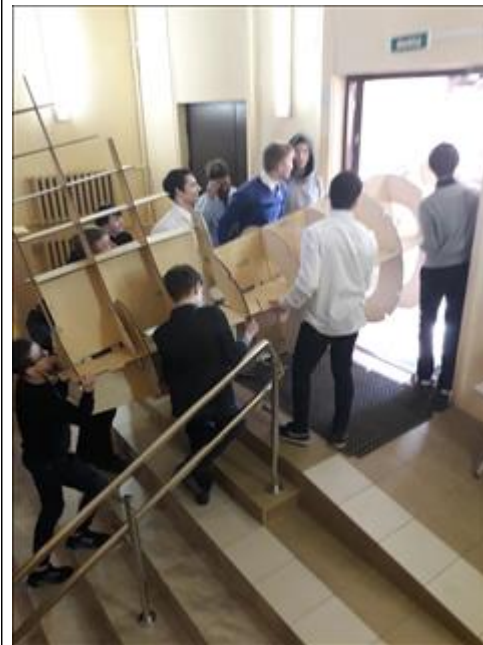
"Мы встретимся с тобой на сборочной площадке № 2"

В торжественной обстановке, посвященной завершению первого этапа сборки полноразмерной копии самолета Ил-2 и началу исследовательской работы, состоялась встреча участников сборки, учащихся 6-9 классов и педагогического коллектива школы с руководителем проекта. Участники встречи подвели итоги сборки хвостовой части самолета Ил-2 и определили дальнейший план работы по сборке самолета Ил-2 совместно с учащимися школы № 457 Красносельского района Санкт-Петербурга на сборочной площадке № 2.