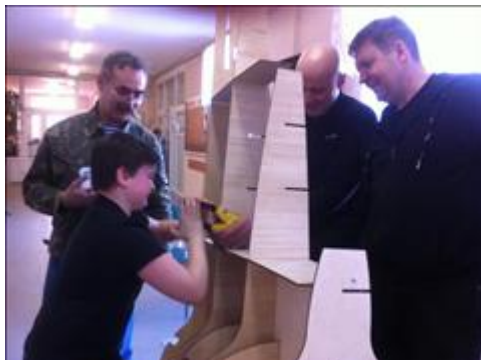
"Еще чуть-чуть" Соединение деталей самолета с помощью заклепок.