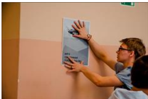
"Самолет будем строить здесь!" Организация сборочной площадки.