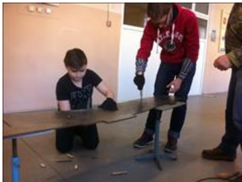
"Ни сучка, ни задоринки!" Окончательная подгонка деталей самолета после предварительной сборки.